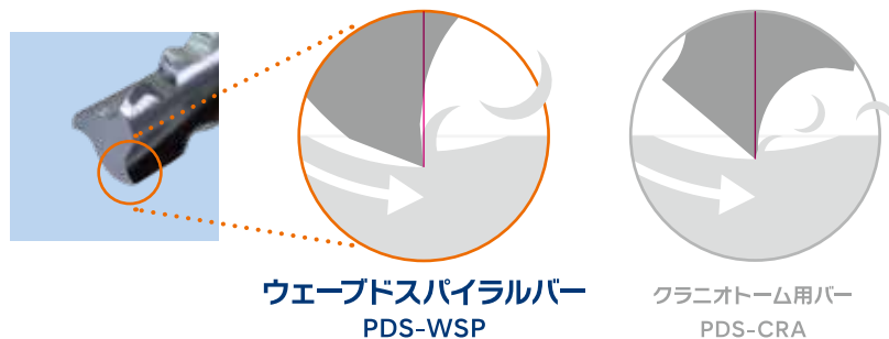
ウェーブドスパイラルバー PDS-WSP

◎ 独自の刃形状により 切削速度を35%向上 ※ クラニオトーム用バーPDS-CRA-M との社内比較テスト